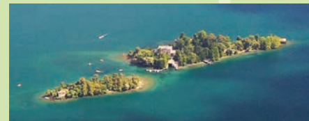
Isole di Brissago

Da Cimetta si gode un panorama mozzafiato a 360° e il delta della Maggia fra Locarno e Ascona il punto più basso, fino al massiccio del Monte Rosa il più alto della Svizzera.