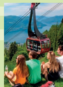
Orselina-Cardada – Cimetta

Con il biglietto d'ingresso – Mit dem Eintrittsbillett – Avec le billet d'entrée Locarno Camelie